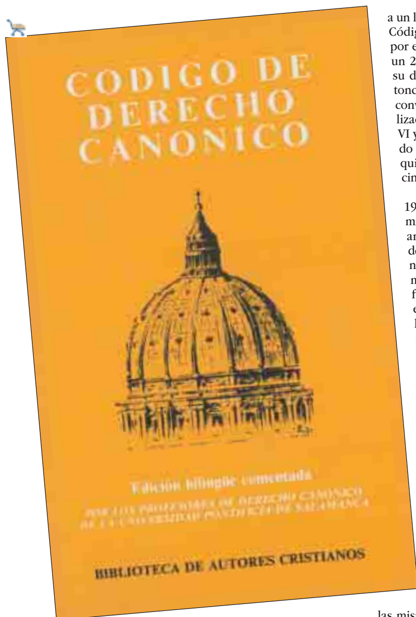
Edición de la BAC del vigente Código de Derecho Canónico

E l 25 de enero pasado se celebró el vigésimo quinto aniversario de la promulgación del vigente Código de Derecho Canónico, que tuvo lugar en ese mismo día del año 1983, con la Constitución apostólica Sacra Disciplinae Leges , del Papa Juan Pablo II. En aquella fecha se puso fin