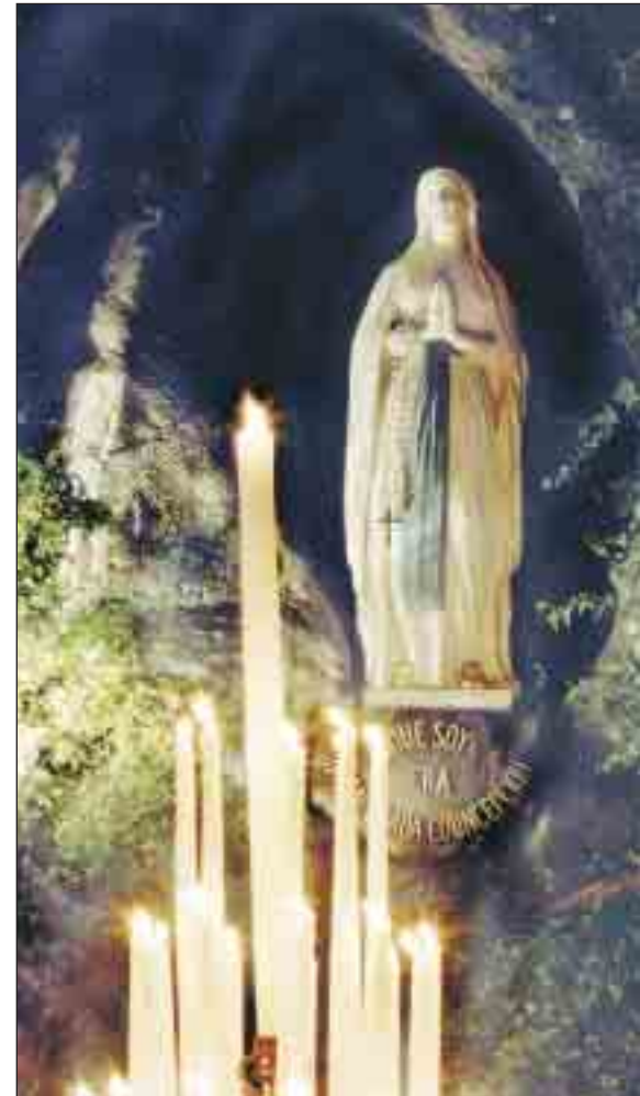
Imagen de la Virgen en la gruta donde se apareció