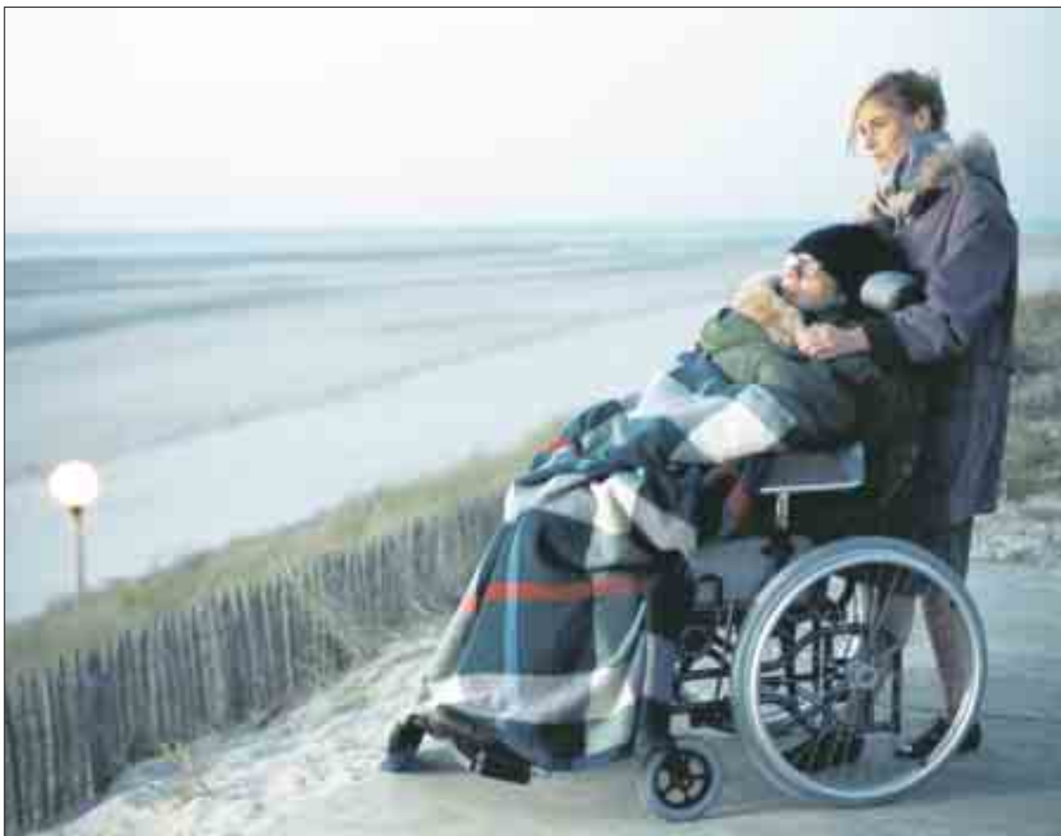
Fotograma de la película La escafandra y la mariposa

Nominada al Oscar al mejor director, al mejor guión adaptado, a la mejor fotografía y al mejor montaje, y ganadora del Globo de Oro al mejor director y a la mejor película de habla no inglesa, La escafandra y la mariposa llega a nuestras pantallas como un canto a la vida que merece recordar