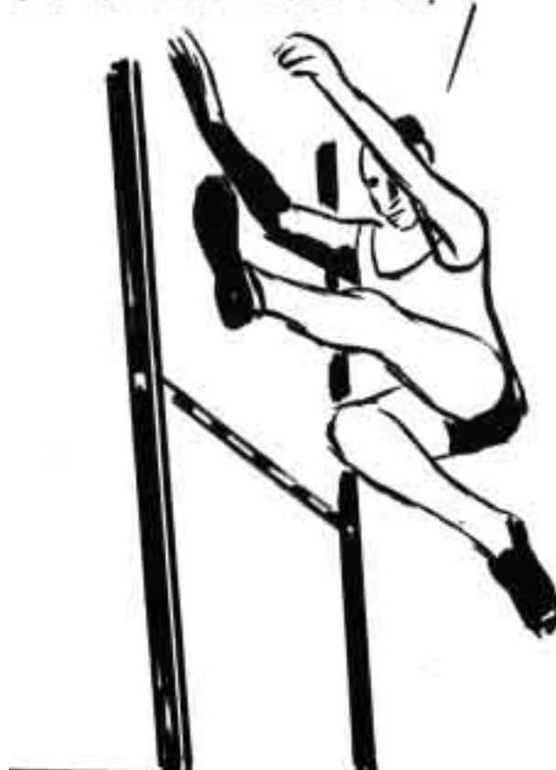
El Roto, en El País

ESTO NO ES NADA. LAS VALLAS MENTALES, ¡ÉASAS SÍ QUE SON DIFÍCILES DE SALTAR!