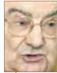
José Sánchez, obispo de Sigüenza- Guadalajara

En la España de hoy no faltan quienes no ven con buenos ojos la presencia de la Iglesia. Preferirían una Iglesia calladita y unos cristianos timoratos y reclusos. Pero tendrán que acostumbrarse a lo contrario. La Iglesia es toda ella Palabra que resuena de todas las maneras posibles en el mundo entero.