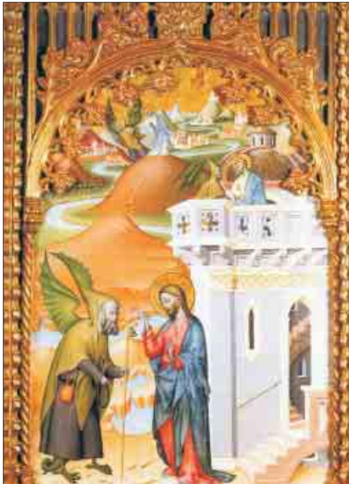
Las tres tentaciones en el desierto. Retablo de la Catedral Vieja de Salamanca