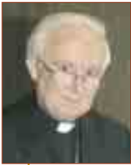
Antonio Cañizares, cardenal arzobispo de Toledo

La Iglesia no tiene otra Palabra que Cristo, ni otra riqueza que Cristo. La Iglesia no dilapidará esta riqueza, ni dejará de ofrecérsela a todos sin imponérsela a nadie. Esta Palabra no la callará jamás, a pesar de los poderes de este mundo que quisieran silenciarla o verla reducida a los espacios sacrales.