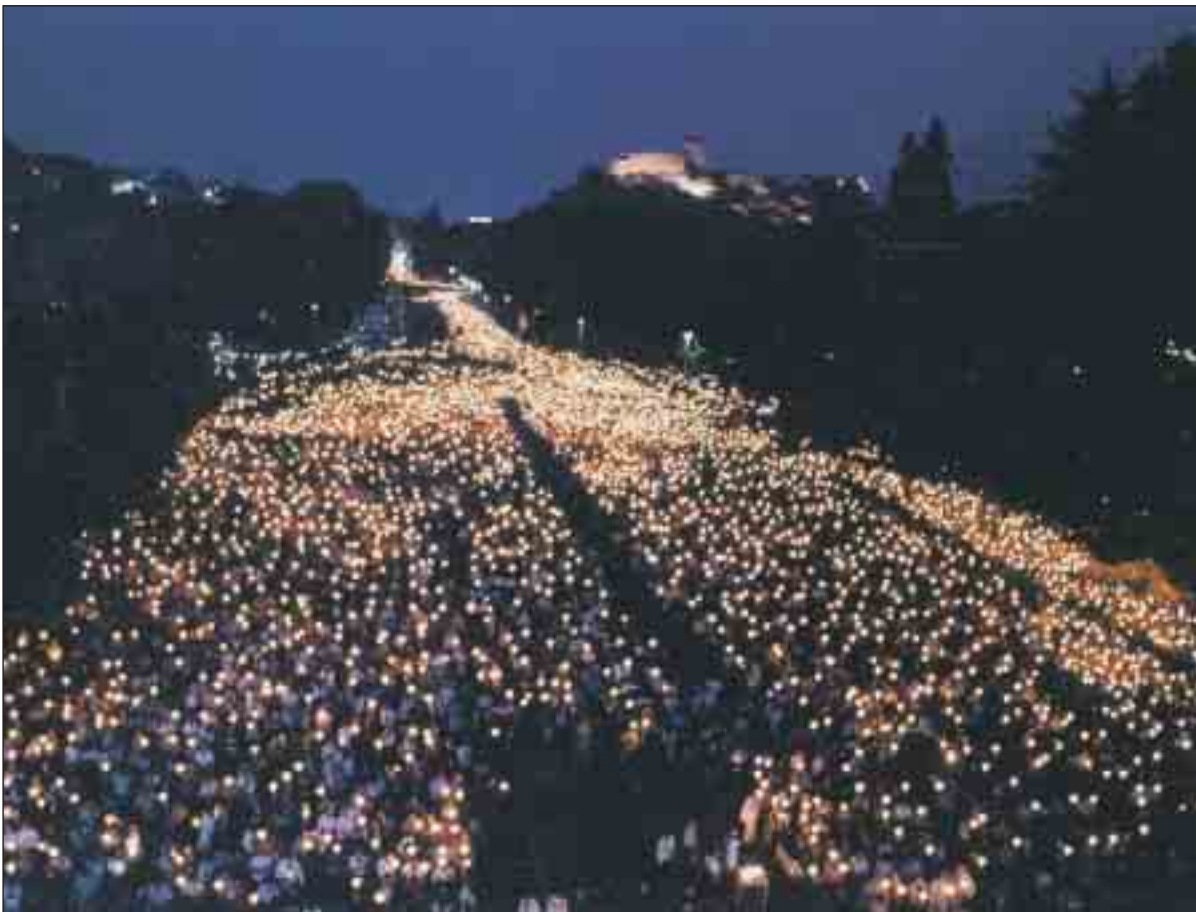
Un momento de la famosa procesión de antorchas . Debajo, la imagen de la Virgen que preside dicha procesión

Al torrente de peregrinos que suele recibir el santuario de Lourdes, se le sumará, este año, un aluvión extra de personas que aprovechen para ganar el Jubileo que el Papa ha concedido, con motivo del 150 aniversario de las apariciones de la Virgen