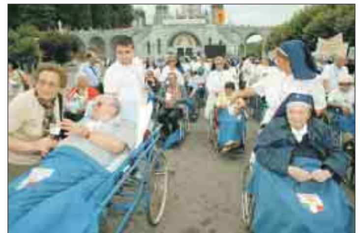
Procesión de enfermos en Lourdes. A la izquierda, los peregrinos rezan en la gruta de la Virgen. Arriba, la explanada del santuario en una de las innumerables celebraciones

inauguró ya el pasado 8 de diciembre de 2007, y que se terminará el 8 de diciembre de 2008. El santuario, durante todo el año, dará especial relevancia a todos los momentos litúrgicos importantes del año y, además, celebrará con especial cariño las fechas de las apariciones.